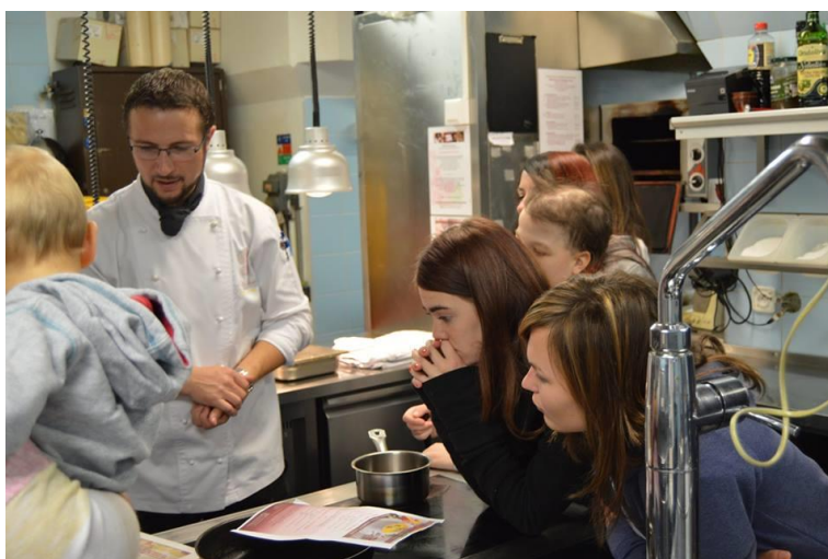
Exkurze v hotelu Adria